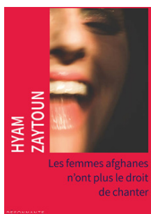
LES FEMMES AFGHANES N'ONT PLUS LE DROIT DE CHANTER Hyam Zaytoun Éditions La Résonnante