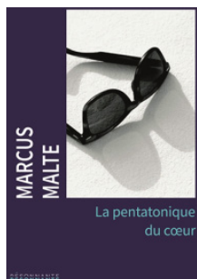
LA PENTATONIQUE DU COEUR Marcus Malte Éditions La Résonnante