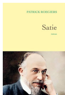
SATIE Patrick Roegiers Éditions Grasset