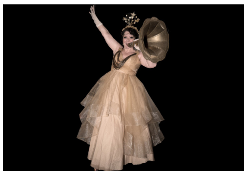
La Bâronne de Paname, maîtresse de cérémonie