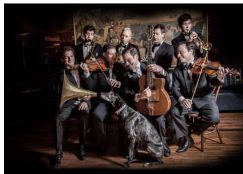
The Duved Band