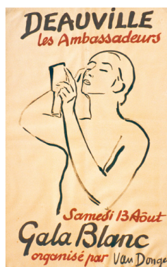
Kees Van Dongen, Bal des Ambassadeurs , Gala Blanc, 1932, Yves Aublet © ADAGP, Paris, 2022