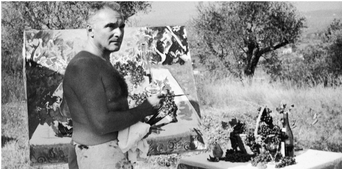
André Hambourg peignant sur le vif date et crédit

En échos aux « vies silencieuses » d'André Hambourg, le parcours est enrichi d'œuvres du XVIII e au XXI e , attribués à Jean-Siméon Chardin ou signées, entre autres, de Francis Harburger et Daniel Spoerri.