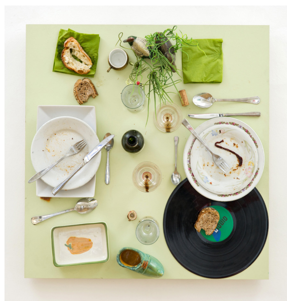
Daniel Spoerri, Table de bistro de Saint-Marthe , 2014, assemblage, Collection Les Abattoirs, Musée-Frac Occitanie Toulouse

© ADAGP, Paris, 2022 Photo Courtesy Rita Newman et l'artiste