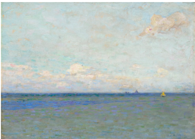
Henri Le Sidaner, Voiliers sur la mer , 1896, huile sur toile, Collection Peindre en Normandie, Ville de Deauville, Les Franciscaines