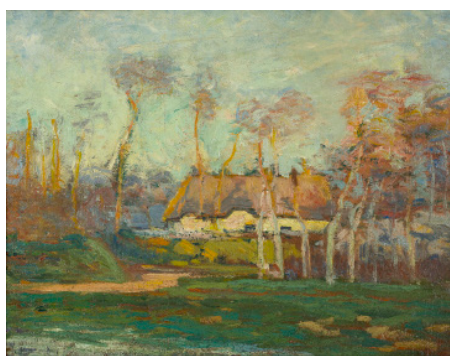
Othon Friesz, La chaumière à Fontaine-la-Mallet , 1901, huile sur toile, Collection Peindre en Normandie, Ville de Deauville, Les Franciscaines