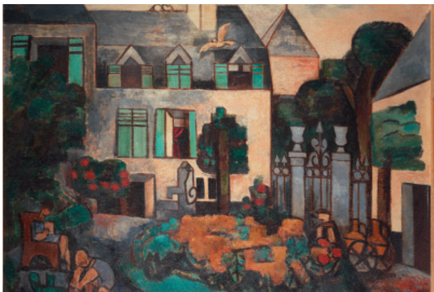
Marcel GROMAIRE Renault-foie , 1927, huile sur toile, Collection particulière © D.R. / Illustria © Adagp, Paris, 2023