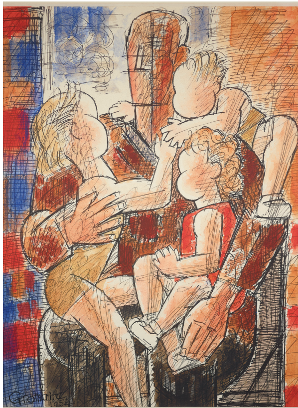
Marcel Gromaire, Marcel Gromaire et ses petits-enfants (détail) , 1954, aquarelle, plume et encre noire sur papier, collection particulière

De la mise en scène de ses proches, à la représentation de la maison familiale, située sur la Côte Fleurie, l'exposition propose de rentrer dans l'univers personnel du peintre et présente une série de toiles, gravures et dessins, à l'iconographie figurative, caractérisées par un style rigoureux et géométrique, à la palette de couleurs chaudes.