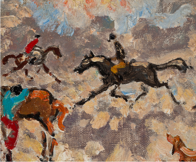
André Hambourg, La reprise (détail), 1970. Donation Nicole et André Hambourg, Ville de Deauville, Les Franciscaines © ADAGP, Paris, 2024

Visite libre du mardi au dimanche de 10h30 à 18h30