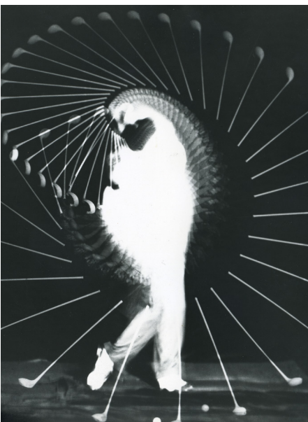
Harold Eugene EDGERTON Bobby Jones taking a swing (detail), 1938, Tirage postérieur sur papier aux sels d'argent, Paris Galerie Françoise Paviot