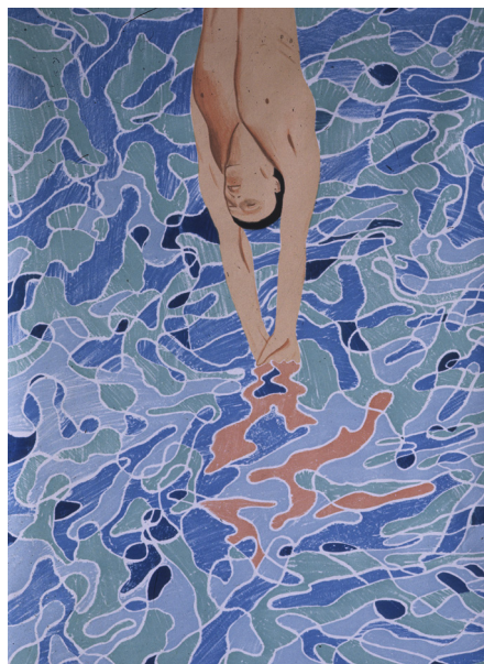
David HOCKNEY Olympische Spiele München, 1972 , Tirage papier Nice, Musée National du Sport