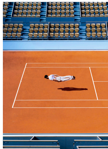
Forgetmat, ACE / Roland Garros (detail) , Paris 2022, Fine art Paper, Collection de l'artiste © Forgetmat