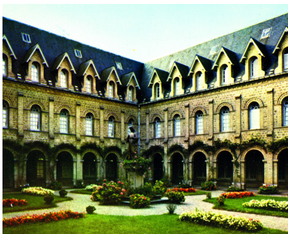
Le Cloître vers 1960