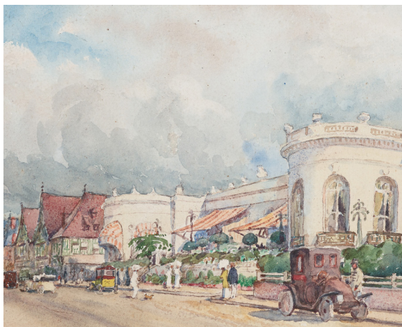
René Degommier Casino, Deauville 1ère moitié du XX e siècle

SAMEDI 16 SEPTEMBRE VISITE DU CASINO DE DEAUVILLE + EXPOSITION « FAITES VOS JEUX ! »