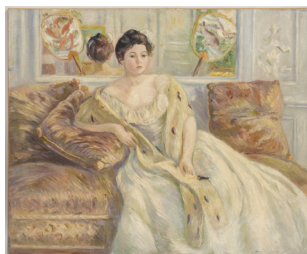
Julie MANET Jeune femme à l'étole d'hermine 1898-1899 Huile sur toile, Collection particulière