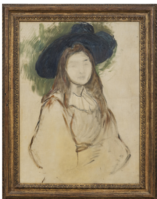
Berthe MORISOT Portrait de Julie Manet dit « au chapeau liberty » 1894 Huile sur toile Collection particulière

La seconde partie, à partir de 1900, déploie l'art de vivre et de peindre de toute une vie, les instants peints par Paule Gobillard, Julie Manet mais aussi Ernest Rouart, et court jusqu'en 1939.