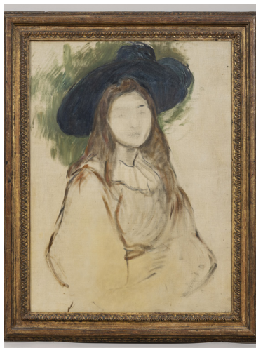
Berthe MORISOT Portrait de Julie Manet « au chapeau liberty » 1894 Huile sur toile Collection particulière