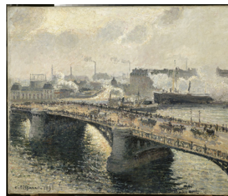
Camille PISSARRO Le Pont Boieldieu à Rouen 1896 Huile sur toile Paris, Musée d'Orsay En dépôt au musée des Beaux-Arts de Rouen