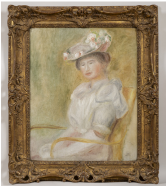
Auguste RENOIR Portrait de Julie Manet 1899 Huile sur toile Collection particulière

La reproduction de ces visuels est autorisée à titre gracieux uniquement dans le cadre de l'illustration d'articles concernant l'exposition et pendant sa durée, droits réservés pour toute autre utilisation. Il conviendra de faire figurer le nom de l'artiste, le titre et surtout le crédit ainsi que le copyright. Pour toute demande de visuels, contacts presse en page 16.