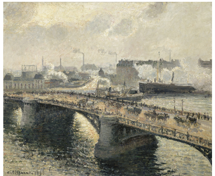
Camille PISSARRO Le Pont Boieldieu à Rouen 1896