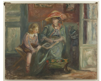
Paule GOBILLARD Madame Paul Valéry et son fils Claude vers 1910 Huile sur toile Paris, Petit Palais, musée des Beaux-arts de la Ville de Paris