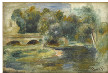
Auguste RENOIR Pont sur une rivière Entre 1841 et 1919 Huile sur toile Paris, Musée d'Orsay En dépôt au musée des Beaux-Arts de Bordeaux