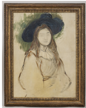
Berthe MORISOT Portrait de Julie Manet « au chapeau liberty » 1895 Huile sur toile Collection particulière